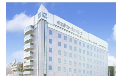
ホテル名古屋ガーデンパレス